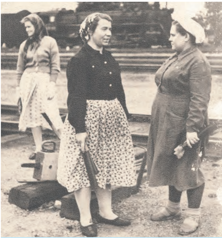
«Родители между собой и сослуживцами только и говорили, что о Ее величестве железной дороге»