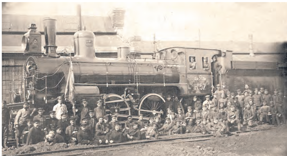
Отремонтированный паровоз – подарок рабочих депо «Восточное» к 1 Мая. 1925 год

– Мы все попали в батальон 1323, участвовали в боях за Мариуполь, брали комбинат им. Ильича. Затем стояли