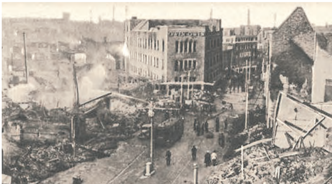
Сталино после освобождения. Сентябрь 1943 года

Подробно оговаривался механизм изъятия у населения продовольствия и сельскохозяйственных ресурсов. В первую очередь, изымались дефицитные семена, особенно овощных и кормовых культур, полностью зерно и масличные культуры, включая семенной и потребительский (индивидуальный) фонды. Породистый и прочий скот, за исключением свиней, передаваемых войсковым частям, а также скот крестьян предписывалось переправить на западный берег Днепра. Изъятию также подлежал ценный сельскохозяйственный инвентарь, в том числе станки МТС (машинно-тракторных станций), запчасти, приводные ремни.