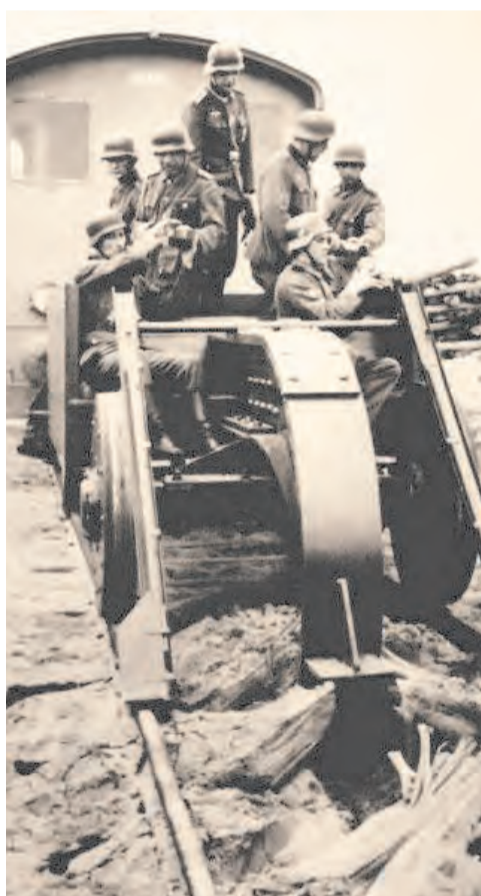
Немецкие войска используют Schwellenpflug для разрушения ЖД

После оставления Сталино и Мариуполя немецкие войска спешно побежали из Донбасса. Уже 14 сентября наши войска вышли на границу Сталинской области и действовали уже на территории Запорожской области.