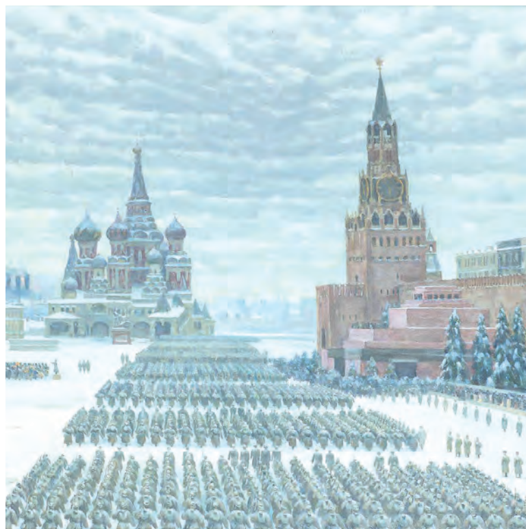
«Парад на Красной площади в Москве 7 ноября 1941 года». Автор: Константин Юон. 1942 г.

а позднее вместе с кадрами парада – в документальную ленту режиссеров Леонида Варламова и Ильи Копалина «Разгром немецких войск под Москвой». Фильм вышел на экраны 23 февраля 1942 г., а в 1943-м получил первый в СССР американский «Оскар» в номинации «Лучший документальный фильм». Для проката в Америке фильм был перемонтирован, переозвучен и назван «Moscow Strikes Back» («Москва наносит ответный удар»). Показ картины за рубежом имел политическое значение и воспринимал-