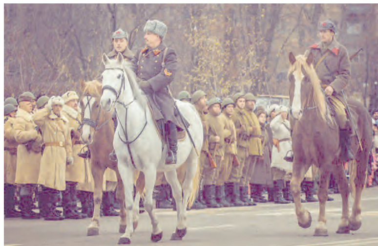
Реконструкция парада 7 ноября 1941 года в Воронеже

Парад поднял моральный дух военнослужащих и населения. Для многих современников празднование годовщины Октября в военных условиях стало неожиданностью, а фронтовики и работники тыла посчитали это знаком, что Москва сможет выстоять.